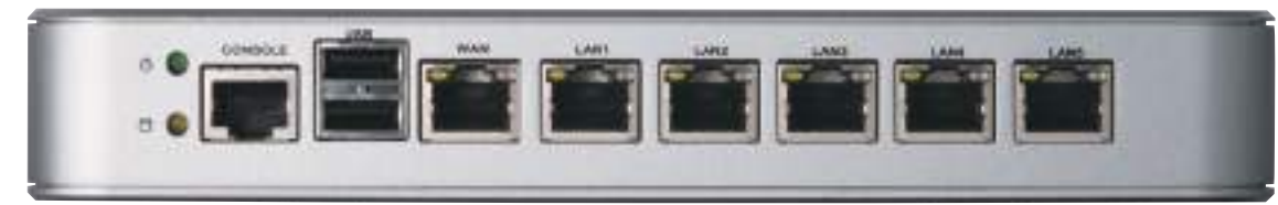
UTM-70E plus 正面パネル